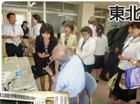
講演・取組事例紹介・パネル討議・ポスターセッションが行われました。

看護、介護の現場においては、刻々と変化する状況に対応するために様々なアイデアが生まれています。そのアイデアを大学などの研究及び企業などの技術によって具現化し、ものづくり、知的財産創出に繋げることは、医療水準の向上のみならず、産業の発展にも大きく寄与するものと考えられます。