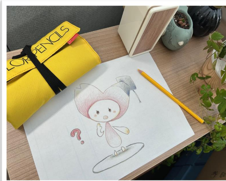
▲表紙イラスト（案）の製作