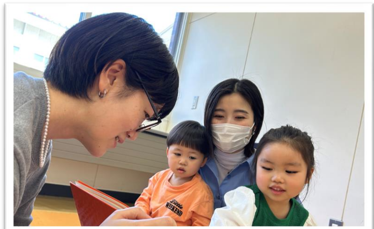
▼絵本の読み聞かせの様子

保育施設や小学校を募集しますので、ぜひご要望ください。ホームページ上では活動報告をさせていただきます。