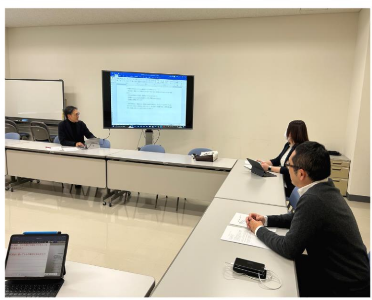
▲事業担当者の打ち合わせ風景