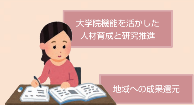
大学院機能を活かした人材育成と研究推進