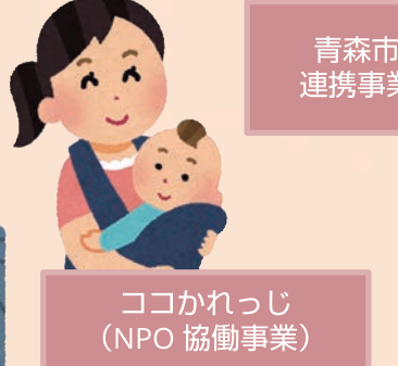
ココかれっじ (NPO 協働事業)