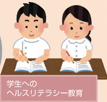
学生へのヘルスリテラシー教育