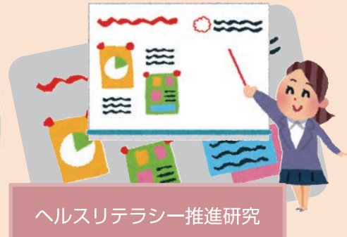
ヘルスリテラシー推進研究