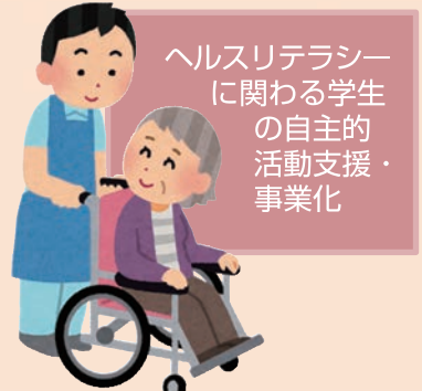
ヘルスリテラシーに関わる学生の自主的活動支援・事業化