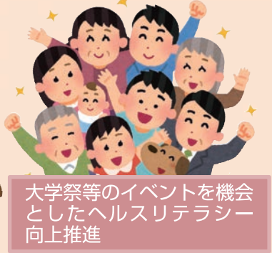
大学祭等のイベントを機会としたヘルスリテラシー向上推進