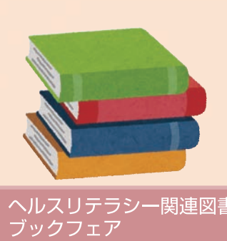
ヘルスリテラシー関連図書のブックフェア