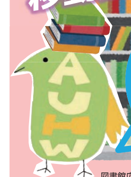
図書館広報キャラクター「トリゾウ」