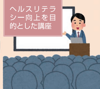
ヘルスリテラシー向上を目的とした講座