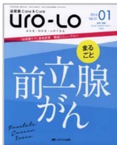
新タイトル： Uro-Lo: 泌尿器 Care & Cure