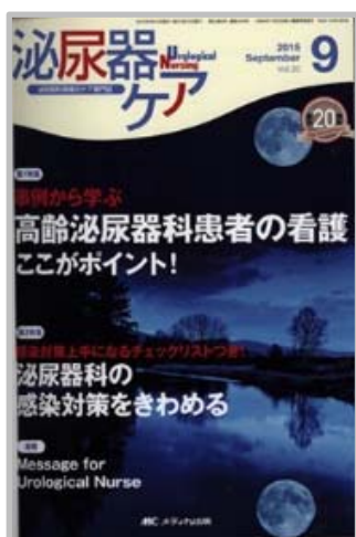
旧タイトル： 泌尿器ケア