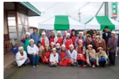
味祭館を運営している「百石ふるさとの味研究会」の皆様と栄養学科学生との交流も深まりました!