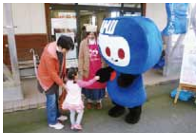
本学マスコットキャラクター「モーリー」もお客様をお迎え♪