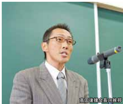
高田後援会長の挨拶

保護者の方々66名がご参加され、全体会及び学科別に分かれた学科別プログラム・個別相談等で熱心に討論されました。