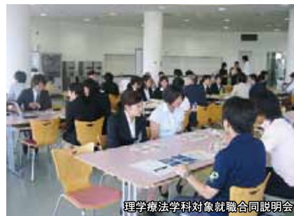
理学療法学科対象就職合同説明会