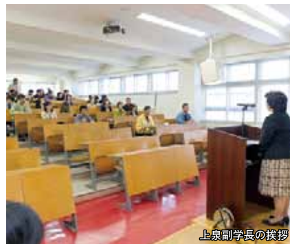
上泉副学長の挨拶