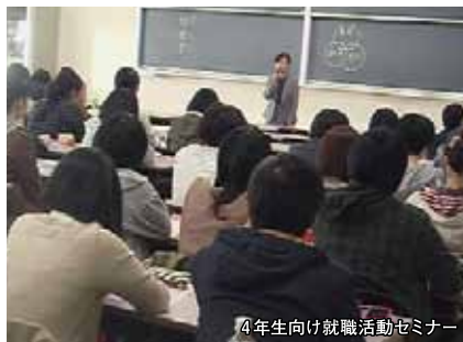
4年生向け就職活動セミナー

6月の県内・外就職合同説明会に引き続き、7月20日(土)に理学療法学科対象就職合同説明会を理学療法学科4・3年生がほぼ全員参加して実施されました。就職活動セミナーを外部講師を招き学年別テーマに沿って年間13回開催予定です。