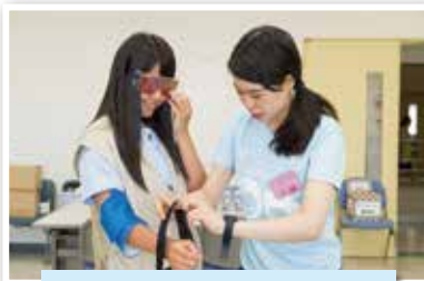
(社会福祉学科)「ミニ高齢者疑似体験」では専用の装具を身に付け、高齢者の生活場面を体験してもらいました。