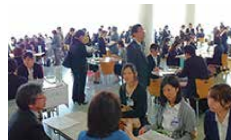
県内就職説明会の様子

青森県は多くの健康課題を抱えています。それだけ、課題解決のためにチャレンジしがいのある地域でもあります。是非、青森県に就職、または、Uターンしていただき、大学とつながりをもってキャリアアップしていただきたいと望んでおります。