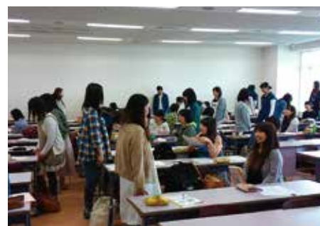
面接の受け方(5月14日開催)