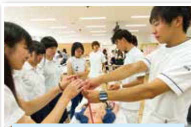
(看護学科)「シミュレーターでの看護体験」の様子です。白衣を着ているのは学生ボランティアの皆さんです。

各学科の紹介、興味深い模擬講義、趣向を凝らした体験・見学コーナー、入試・就職状況の説明の他、相談コーナーやキャンパスツアーなど在学生ボランティアが中心となり、様々なプログラムを用意しました。参加者と学生、教員とが交流する様子が多く見られ、見て触れて実感し、保健大学の魅力を感じ取っていただけたのではないかと考えています。