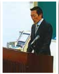
高田後援会長の挨拶