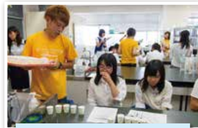
(栄養学科)「味覚検査」の様子です。自分の舌を検査し、減塩の方法等が学べました。