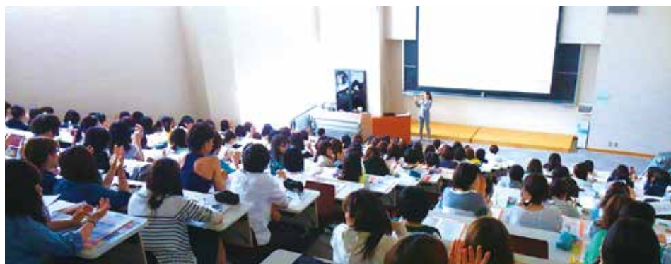
専門職に携わる者としての心構え(7月1日開催)

活対策を、後期は「応募書類の書き方」「面接の受け方」等就活に役立つものを、1年生向けには「専門職に携わる者としての心構え」、2年生向けには「就職活動の全体像とキャリアプラン」等の将来の就活を意識したものを実施しています。