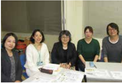
看護管理学(博士前期課程)履修の院生と

看護マネジメント領域は、看護ケアの質の向上をめざして、ケア提供の仕組みやケア提供者の資質向上を図るにはどのようにあたらいいかを探求する領域です。これまで博士前期課程が26名、博士後期課程は8名が修了し、教育、管理領域で活躍しています。研究テーマは様々ですが、最近の研究論文では、「看護ケアのアウトカム(成果)に影響を及ぼす要因の分析」や「看護職の仕事と生活の調和(ワークライフバランス)」の研究などがあります。