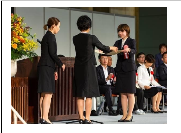
第3回食育活動表彰 農林水産大臣賞受賞 [6月]