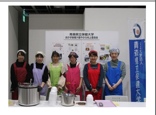
あおもり食育推進大会2020 食育に関する展示・体験コーナー [2月]