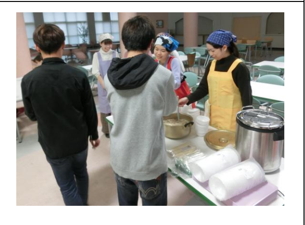
寮生へのおかず味噌汁提供 [12月]