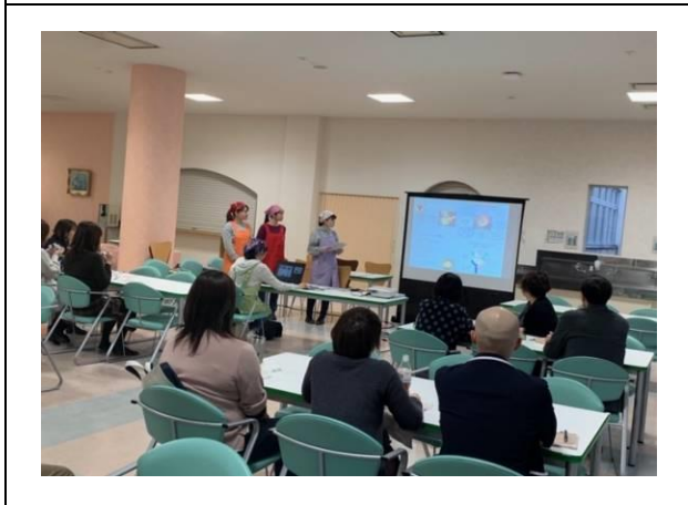
職員研修会の様子 [2月]