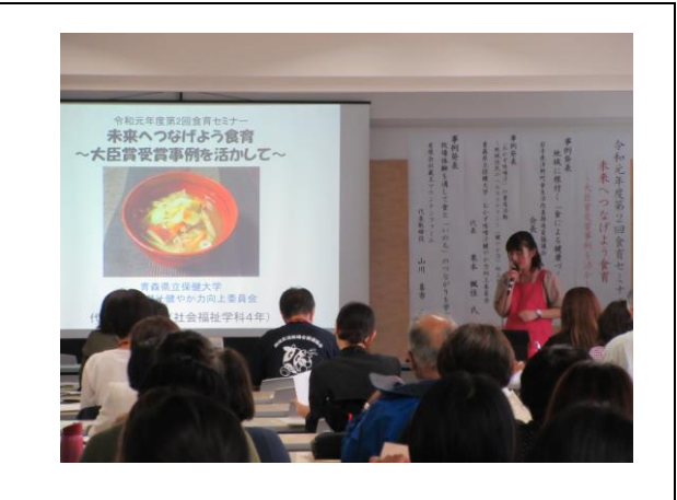
食育セミナーにてパネリストとして参加 [9月]