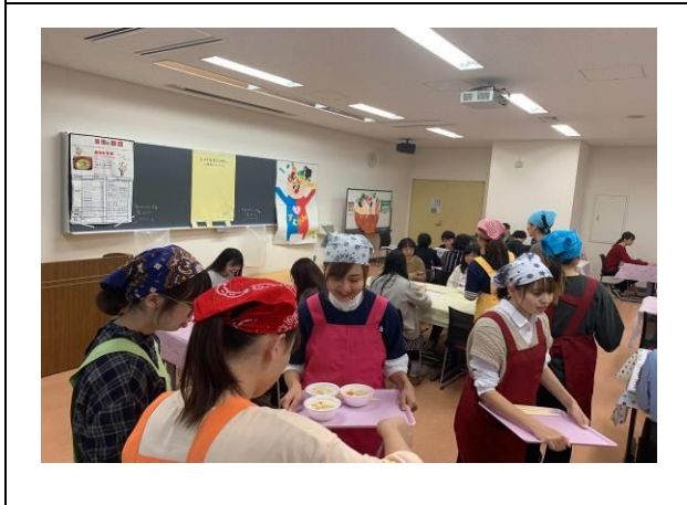
毎年恒例 大学祭に出店 [10月]