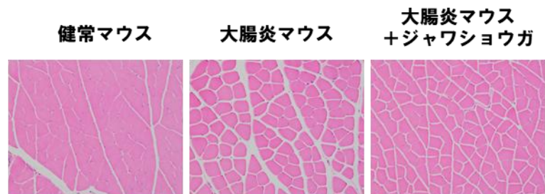
筋肉の線維の太さ (図2)

その仕組みとして、ジャワショウガが筋肉分解に関わる遺伝子の働きを抑える信号 (Akt/FoxO1/NFκB 経路) を調節し、筋肉分解を進める Atrogin-1 および MuRF-1 (*5) を減少させること、さらにミトコンドリア (*6) を増やして筋肉のエネルギー源を確保したことが推測された。このような働きによって、ジャワショウガは潰瘍性大腸炎における大腸および筋肉の健康を保つことが分かった。