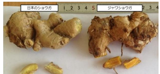
日本のショウガとジャワショウガ (図1)

潰瘍性大腸炎 (*1) は難病指定されており、患者数が増加している。その約3割は、筋肉が減るサルコペニア (*2) を合併するという報告がある。インドネシア原産のジャワショウガ (図1) は様々な効果があるが、潰瘍性大腸炎の筋肉に及ぼす影響は十分に調べられていなかった。そこで本研究