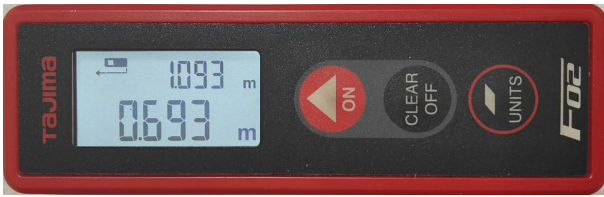
図2. Tajima社製のレーザー距離計

バランス検査の道具として使用するため軽量 (50 g) であること、また、レーザー距離計法を転倒リスクのある高齢者に適用することから、操作が簡単である Tajima 社製のものを採用した。中央の ON ボタンを一度押すと照射物までの距離を測定できる。もう一度 ON ボタンを押すと再度レーザー光が照射され、もう一度押すと再度距離を測定することができる。