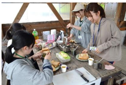
「ボランティア入門セミナー」

■事業区分「学・生」は「学習・生活習慣支援事業」の略です。また、看板事業は、宿泊の伴う事業です。■単位は1日の参加につき1単位取得できます。■実践レポートは毎回提出しても構いませんが、取得できるのは1単位までとなります。■計7単位以上取得した者には「マスターボランティア証」を交付します。また計30単位以上取得した者は「レジェンドボランティア」として認定します。