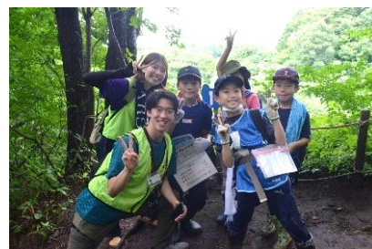
「9歳チャレンジキャンプ(R5)」